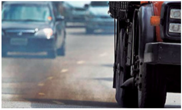
POLUIÇÃO DO AR

Os pedidos surgiram após revelação de reunião secreta com pastores em que Crivella garantiu soluções para o IPTU e agilidade para cirurgias de catarata aos fiéis.