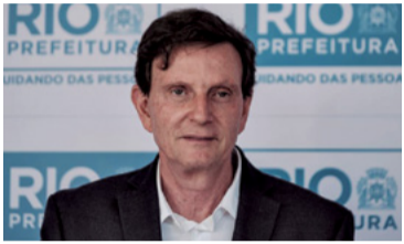
ESTADO LAICO? - 2

A Câmara de Vereadores rejeitou ontem levar adiante os pedidos de impeachment contra o prefeito do Rio de Janeiro Marcelo Crivella, PRB.